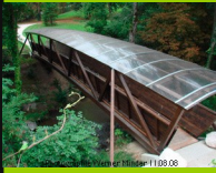
Genève Grand-Lancy De la Colline 564

Unbeachtet überquert man mit dieser Brücke die Versoix. Weiter Bachaufwärts wurde in grosses Gebiet naturalisiert. Schön zum spazieren und erholen.