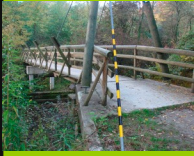
Versoix Passerelle haubané 581

Malheureusement placé sous l'autoroute ce magnifique ouvrage insolite.