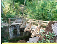
Passerelle Moulin du Creux 954