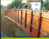
Versoix Village 582

Leider befindet sich dieser Übergang unter der Autobahn. Ein einmaliges schönes Tragwerk.