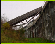
Genève Chancy 562

Angenehme zeitgenössische Brücke, leider über einem Bach, welchen man lieber nicht anschaut, verschweige recht.